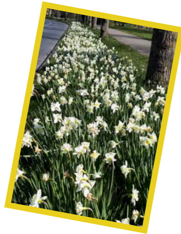
Narcissen in Monnickendam