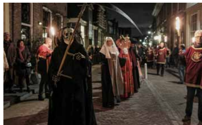
Allerzielentocht Monnickendam

Op 2 november wordt wereldwijd Allerzielen gevierd: de dag waarop we de overledenen van het afgelopen jaar herdenken. De manier waarop dat gebeurt is heel verschillend. In Mexico wordt gegeten en gedanst op de begraafplaats; er zijn lichtjesroutes, lampionnen, processies en missen. Sinds 2005 (de stadsfeesten van het 650-jarig bestaan van de stad) wordt in Monnickendam de Allerzielentocht gehouden, in de volksmond: de Dodendans. In deze 'Dance Macabre' danst de Dood in hoogst eigen persoon door de stad, een zwart rafelig kleed, holle ogen, een zeis in de hand. Hij klopt aan deuren om mensen op te halen. Er hangt al een hele sliert mensen achter hem, mensen van allerlei pluimage: een arme visser, een koning, een bakker, een koningin, de Paus, een jonge maagd, een non en een bisschop, een geleerde professor. Niemand ontkomt aan de dwingende roep van de Dood om aan te sluiten bij de dans. Doedelzakken en trommel spelen een een-tonige, indringende dansmelodie. Het gaat twee passen vooruit en een pas achteruit, achter de Dood aan, in het licht van flakkerende fakkels.