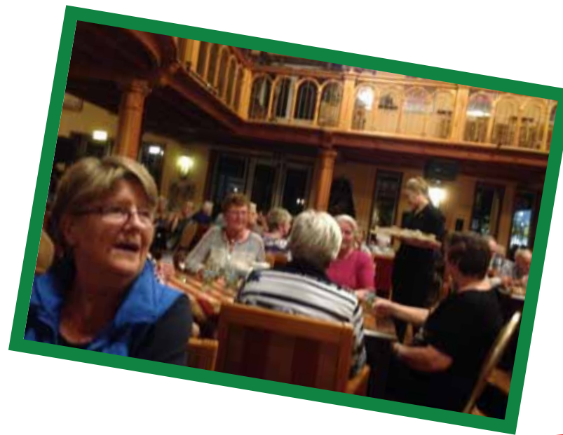
Ouderendag 2017 Rijper Eilanden