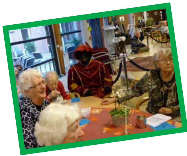
Beelden van de Sinterklaasviering in 2012