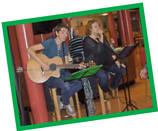
Sinterklaas in Swaensborch 2016