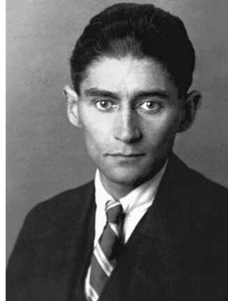
Kafka in 1923

Hoewel Gregor zijn menselijk denk- en gezichtsvermogen behoudt, waardoor hij merkt hoe er op hem wordt gereageerd, kan