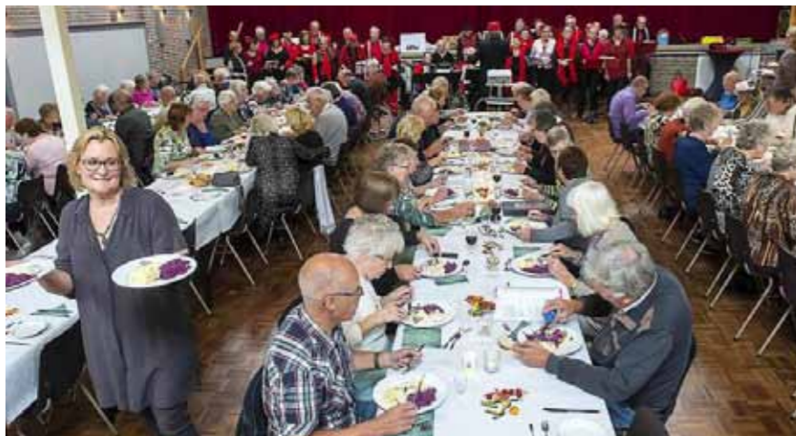
Open eettafel in het Trefpunt op Marken

P.S.: Als u gebruik maakt van deze diensten, moet u lid worden van Wonen Plus. Voor de kosten: zie de website van Wonen Plus.