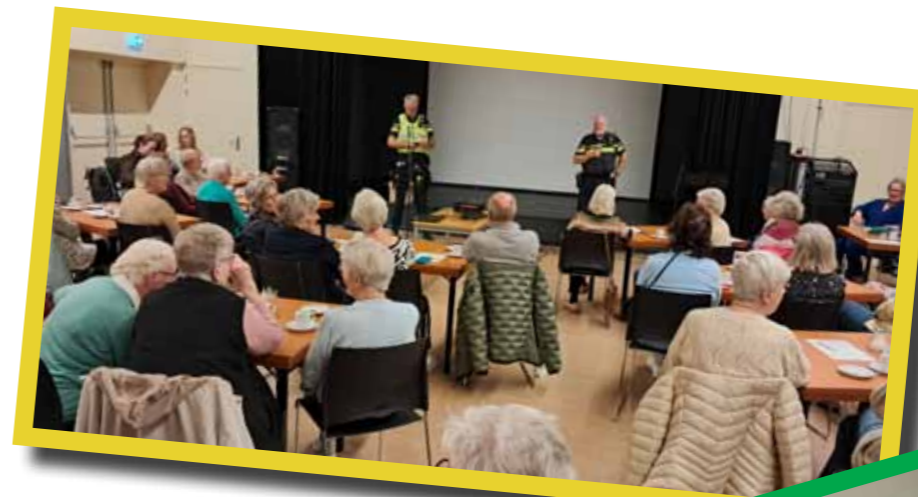
Thema-ochtend SGOM 2024

Voor de bezorging van dit magazine verstrekt de gemeente éénmaal per jaar in maart geanonimiseerde adresgegevens van 65+ inwoners van Monnickendam en Katwoude. Als u het magazine niet wilt ontvangen, wilt u dat dan melden bij het secretariaat van de SGOM.