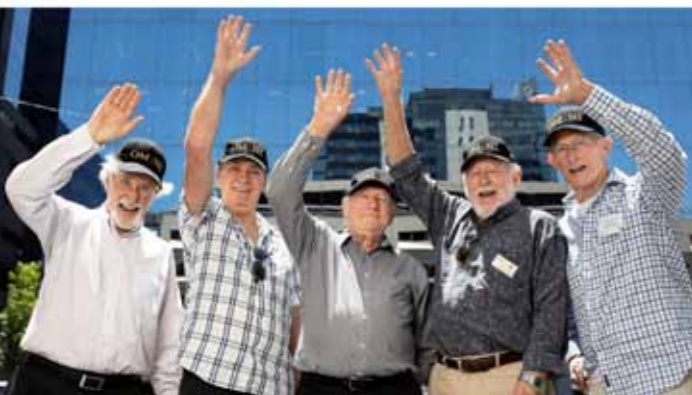
Waar blijven de Monnickendamse mannen?

PS. We zien dat er veel vaker dames aanwezig zijn als er iets georganiseerd wordt. Heren, als u een bepaalde activiteit interessant vindt, laat het ons weten.