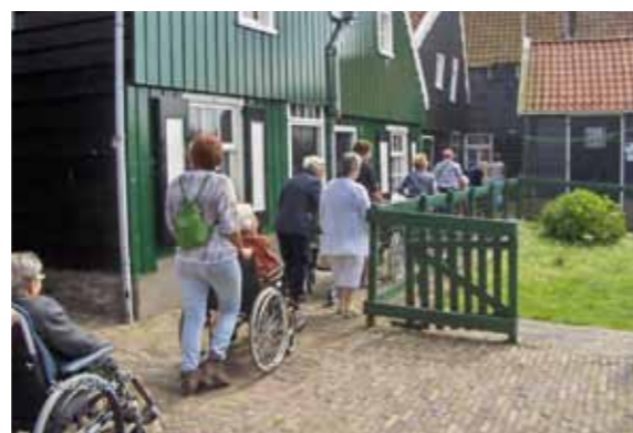
De seniorenvierdaagse doet Marken aan