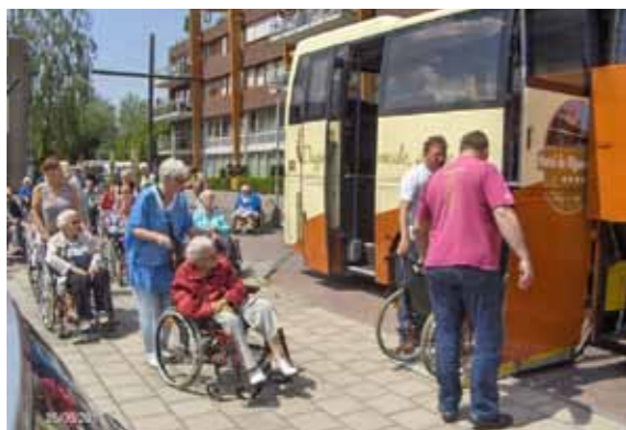
Vervoer tijdens de seniorenvierdaagse

Vrijdag 30 juni wandelen we in Monnickendam en wordt de vierdaagse feestelijk afgesloten.