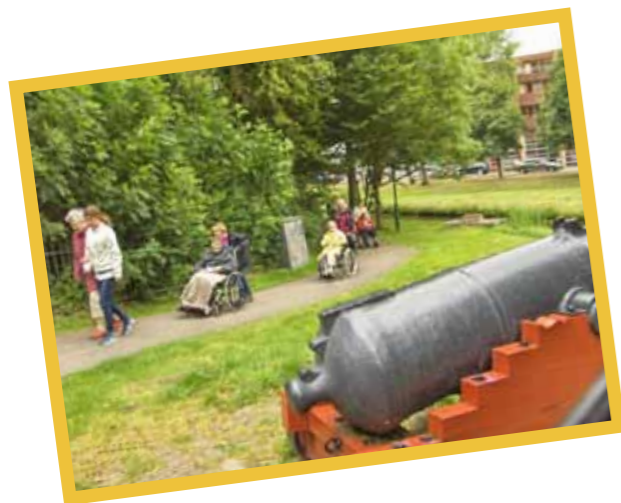
Impressie van de Seniorenvriedaagse